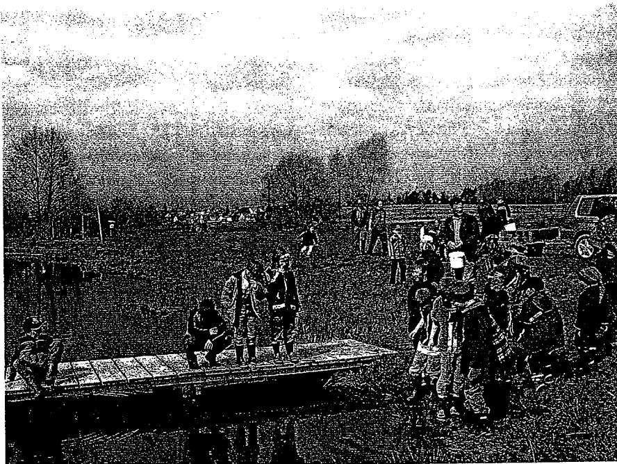
Unterwegs auf Bachsafari