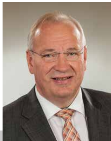
Franz Löffler, Präsident des Bayerischen Bezirkstags

Die sieben Bezirke bilden in Bayern die dritte kommunale Ebene neben den Gemeinden, Märkten und Städten sowie den Landkreisen und kreisfreien Städten. Die Mitglieder der Bezirkstage, die Bezirksrätinnen und -räte, werden direkt gewählt. Die Bezirkswahlen finden alle fünf Jahre zusammen mit den Wahlen zum Bayerischen Landtag statt. An der Spitze der Bezirke stehen die Bezirkstagspräsidenten. Sie werden aus der Mitte der Bezirkstage gewählt.