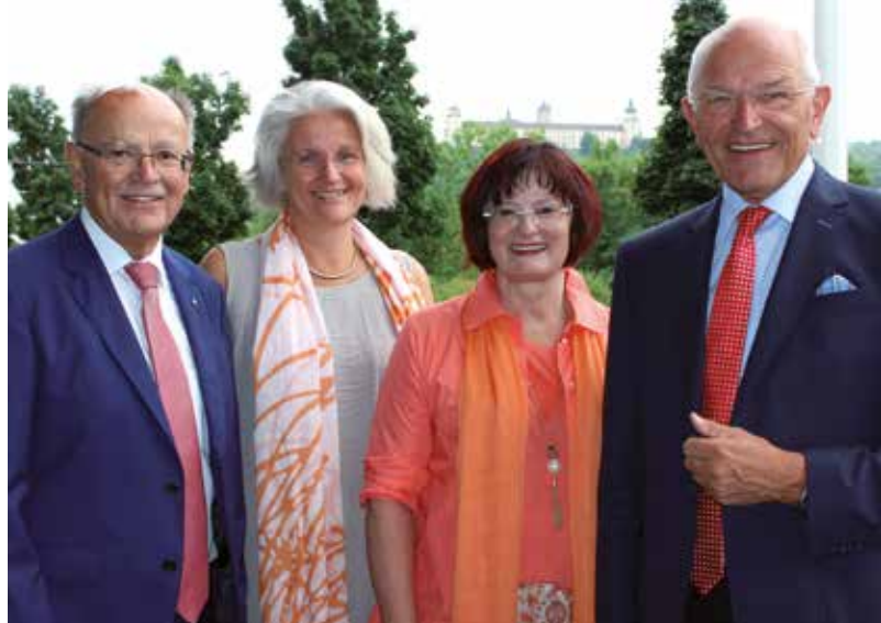
Das Präsidium des Bayerischen Bezirkstags (v.l.n.r.):

Die sieben Bezirke bilden in Bayern die dritte kommunale Ebene neben den Gemeinden, Märkten und Städten sowie den Landkreisen und kreisfreien Städten. Die Mitglieder der Bezirkstage, die Bezirksrätinnen und -räte, werden direkt gewählt. Die Bezirkstagswahlen finden alle fünf Jahre zusammen mit den Wahlen zum Bayerischen Landtag statt. An der Spitze der Bezirke stehen die Bezirkstagspräsidenten. Sie werden aus der Mitte der Bezirkstage gewählt.